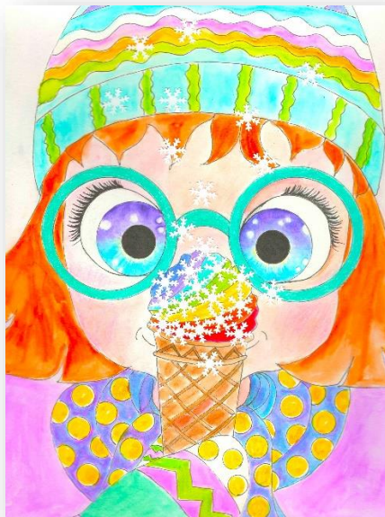
Illustration : De Francheville